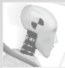
Crashtests nach ECE R44